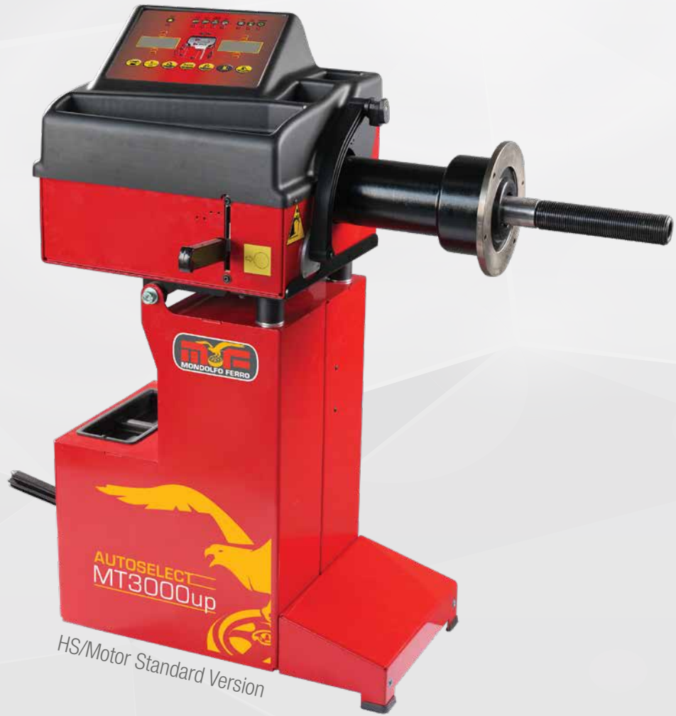
HS/Motor Standard Version